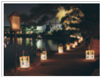
塩見縄手の水燈路